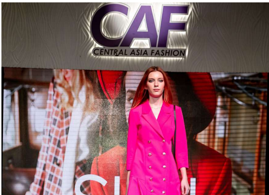
Показ коллекции Central Asia Fashion

А между тем, Central Asia Fashion – одна из ключевых площадок для живых обсуждений и дискуссий экспертов ритейл-рынка: наиболее актуальные вопросы и острые темы поднимаются на бизнес-