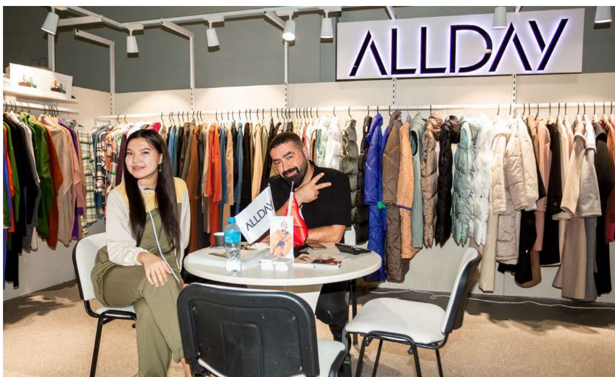
Разнообразие новых участников Central Asia Fashion

В основных разделах выставки представлено 40 групп товаров, включая женскую, мужскую, детскую, вечернюю одежду, обувь, аксессуары, домашнюю одежду, а также одежду больших размеров и для активного образа жизни. Для обеспечения эффективной работы байеров и участников, организатор, выставочная компания САТЕХРО, проводит специальную байерскую программу - Hosted Buyers Program, благодаря которой байеры со всех регионов Центральной Азии могут посетить САФ без финансовой нагрузки.