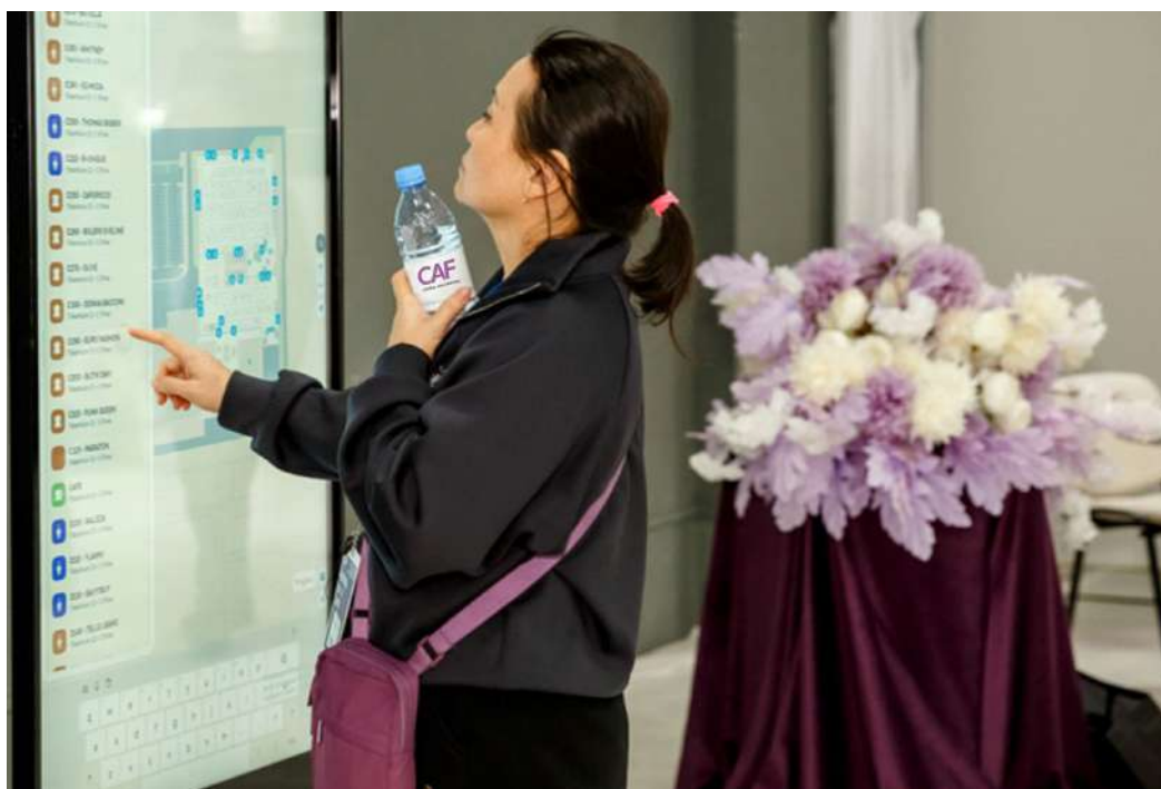
Для комфортной навигации по выставкам для гостей доступна интерактивная 2D-карта павильонов

расписанием модных показов и деловой программы. Киоски с приложением будут размещены у центральных входов и в офисе организаторов. Для посетителей подготовлены инновационная зона Show Area и интерактивная digital-фотозона, создающие дополнительный комфорт и вовлеченность в выставочное пространство. Telegram-бот выставки, которым может воспользоваться любой участник, позволит оперативно получать актуальную информацию о мероприятии, просматривать