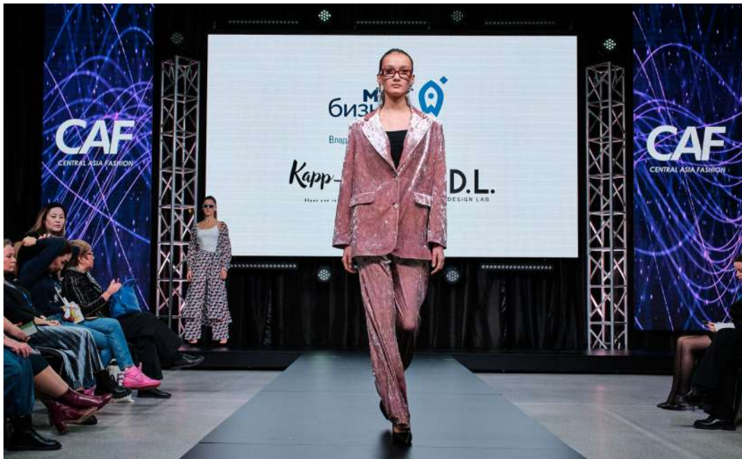
Посетители выставок всегда с нетерпением ждут модных показов от стран-участниц