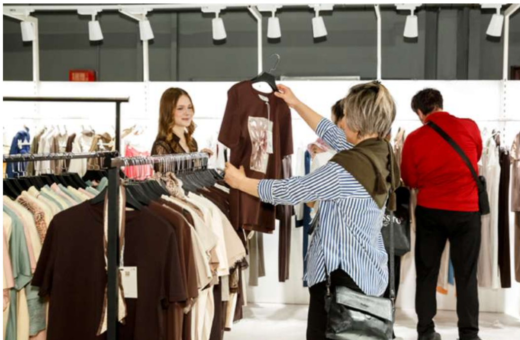
Коллекции по лучшим оптовым ценам ждут байеров из 7 стран мира

Каждый сезон к числу постоянных участников добавляются новые бренды из разных стран. В сезоне Autumn-2026 китайский обувной бренд Ninety Nine Shoes впервые представит новую коллекцию на выставке Eliteline. Особую ценность для выставок представляет участие постоянных экспонентов, которые из года в год выбирают их в качестве эффективной площадки для развития бизнеса и укрепления деловых связей. Так, Центр поддержки экспорта Кировской области является давним участником выставки. В 2025 году в мероприятии впервые принял участие обувной бренд «Лель» из Кирова; в 2026 году он вновь присоединится к числу экспонентов в составе коллективного стенда вместе с другими новыми компаниями. Вновь ожидается участие французского бренда Leo & Ugo, расширяющего свое присутствие в регионе СНГ. Выставка Central Asia Fashion продолжает играть важную роль в стратегии развития этого известного бренда. На CAF Autumn-2026 компания Leo & Ugo представит новые коллекции, отвечающие современным трендам моды.