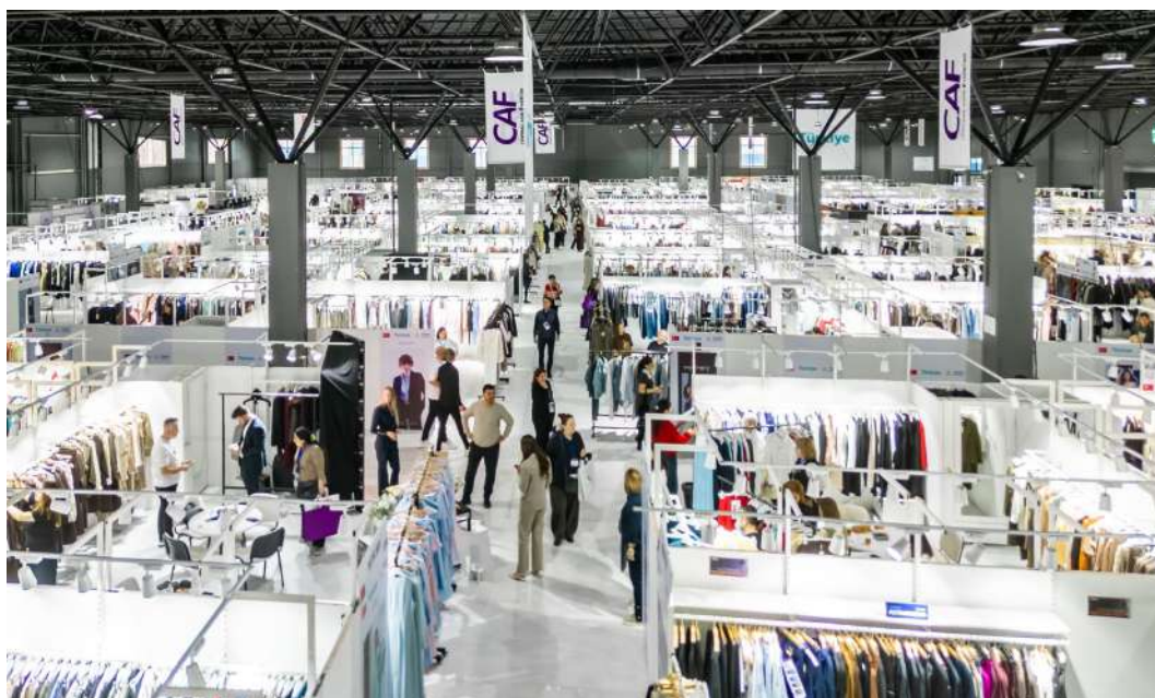
Павильон Международной выставки моды Central Asia Fashion (съемка с дрона)

На одном из самых значимых отраслевых событий модной индустрии Центральной Азии ожидается участие более 200 компаний из Турции, Казахстана, Китая, России, Германии, Италии, Узбекистана, Франции, Украины и других стран. Выставки посетят более 9000 байеров из Казахстана, Узбекистана, Кыргызстана, Азербайджана, Туркменистана, Таджикистана и России. Из раза в раз их количество растет; они приезжают в Алматы для того, чтобы в числе первых получить представление о мировых тенденциях моды и новых коллекциях одежды, обуви и аксессуаров сезона. Эту возможность им дает общение без посредников с представителями компаний-участниц. Байеры оценивают ассортимент товаров и делают предварительные заказы по выгодным оптовым ценам.