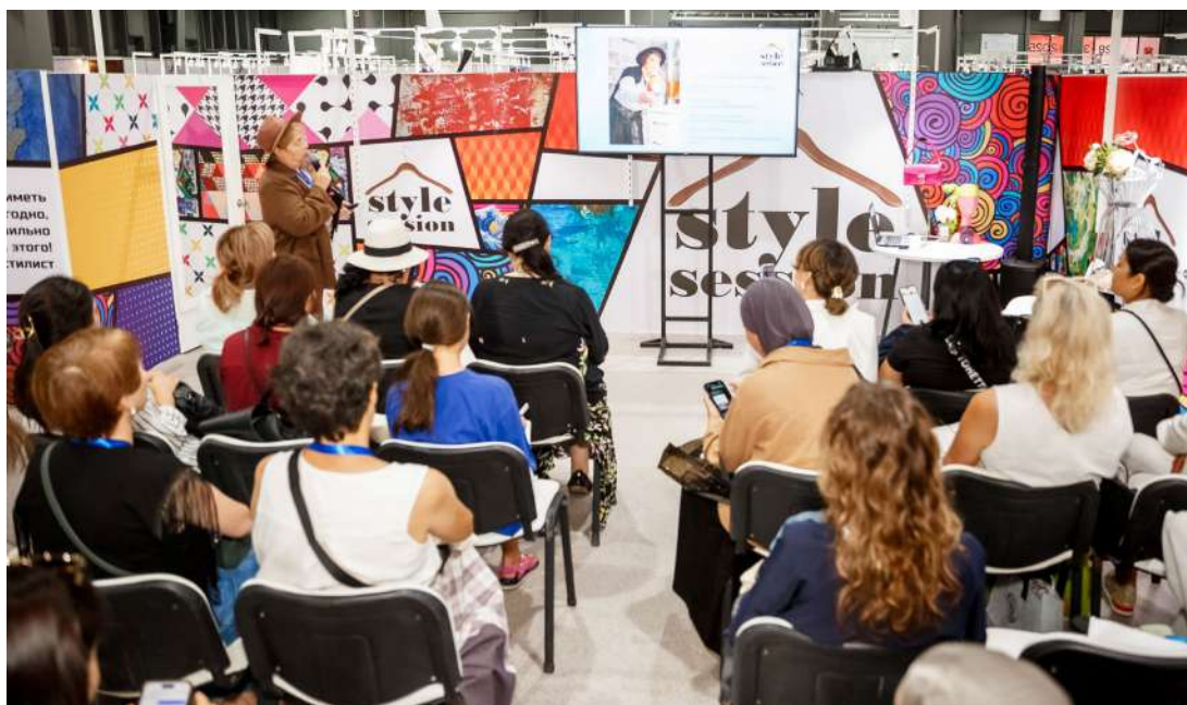
Сессии сообщества имидж-стилистов «Style Session» помогут участникам выставки узнать специфику модного рынка

Бизнес-программа Central Asia Fashion сохраняет статус ведущей экспертной площадки региона. Это уникальный для Центральной Азии формат, где рождаются современные бизнес-модели, обсуждаются глобальные перемены в ритейле и звучат истории успеха, призванные вдохновить тех, кто только начинает свой путь в fashion-индустрии. Площадка служит идеальным местом для нетворкинга: зоны для проведения переговоров будут доступны посетителям без ограничений. Одной из самых содержательных частей бизнес-программы станет консультационный центр стилистов, организованный при участии сообщества «Style Session». Посетители выставки смогут не только проконсультироваться с профессиональными стилистами по вопросам формирования ассортимента и трендам сезона Весна–Лето 2026, но и получить уникальную услугу «Стилист на час», а также прослушать тематические сессии по имиджу, продажам и подбору коллекций.