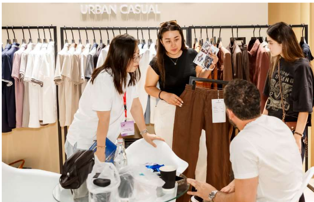
Сезон Spring-2026 предложит байерам расширенный выбор одежды для мужчин

Также байеры получают великолепную возможность на месте сделать закуп коллекций обуви и аксессуаров. Проведение как весеннего, так и осеннего сезона выставки служит постоянным катализатором развития этих модных сегментов в Центрально-Азиатском регионе благодаря стратегическому союзу Euro Shoes & Central Asia Fashion.