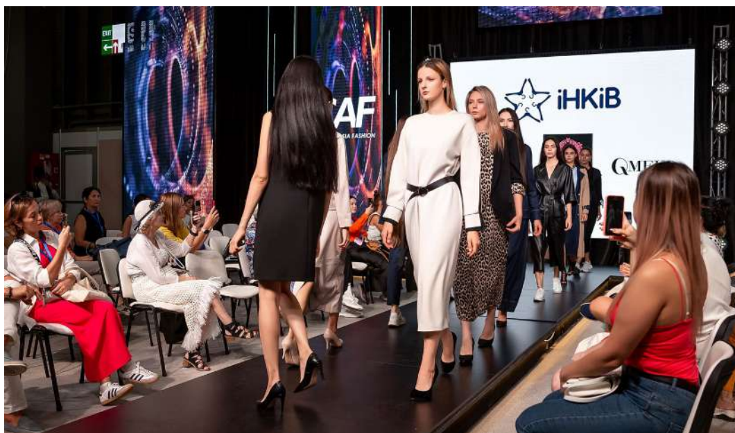
Модные показы стран-участниц вызывают неизменный интерес байеров

Торжественное открытие любого сезона Central Asia Fashion становится ярким событием, и сезон Spring-2026 также обрадует и удивит всех участников выставки. Мероприятие каждый год посещают генеральные консулы разных стран, представители ведущих отраслевых организаций, крупные бизнесмены, известные журналисты, fashion-блогеры и селебрити.