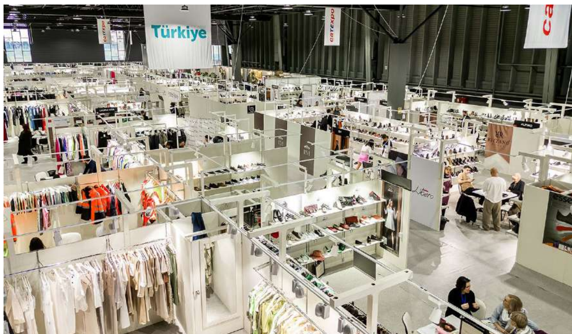
Размах Международной выставки моды Central Asia Fashion (вид сверху)

Флагманское выставочное мероприятие соберет более 220 компаний-участников из 16 стран мира и более 7000 байеров из Казахстана, Узбекистана, Кыргызстана, Азербайджана, Туркменистана, Таджикистана и России. Визитная карточка Central Asia Fashion - возможность байеров в числе первых получить представление о новых коллекциях одежды, обуви и аксессуаров предстоящего сезона 2026. Общаясь напрямую с представителями компаний-участниц, посетители оценивают тренды сезона и ассортимент товаров, делают предварительные заказы по самым выгодным оптовым ценам. Ключевым преимуществом проекта также является возможность налаживания деловых связей; в современной экономической реальности личные контакты и коллаборации зачастую становятся решающим фактором успеха.