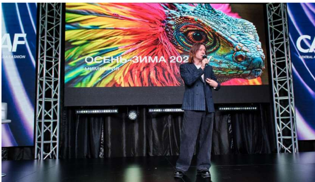
Тренд-сарапшы, халықаралық спикер және лектор Станислав Зимин

Өзінің түйсігі мен көкейкөздігін жоғалту қаупі бар әлемде сән алғашқы даналықтың панасына айналуға. 2026/2027 күз–қыс маусымы — дизайн ритуалдық қорғаныс пен саналы өзін-өзі білдірудің формасына айналатын кезең, мәдени және әлеуметтік өзгерістер арқылы қалыптасқан таныс кодтарды қайта пайымдап, образ арқылы өзін жаңа тәсілдермен жеткізуге жол ашады.